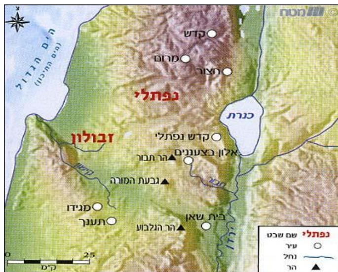
שבוע 5- דף עבודה 1